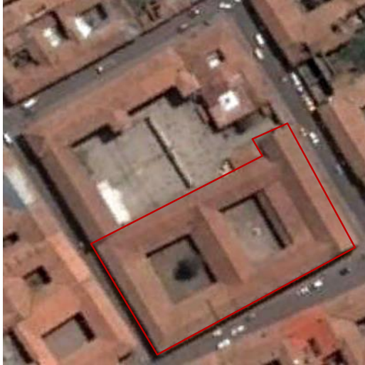
F11 PLANTA DE CONJUNTO - REGISTRO GEOGRAFICO GOOGLE EARTH