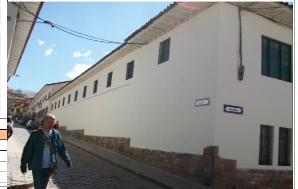
FACHADA NOR-ESTE CALLE TEATRO